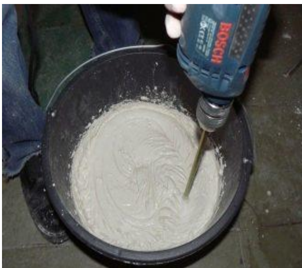
Рисунок 4.1 – Приготовление ремонтных материалов

Для приготовления ремонтного материала применять смесители циклического действия с принудительным перемешиванием. Для приготовления небольших по объему замесов применять электродрель со специальной насадкой со скоростью вращения не более 500 мин -1 . (рисунок 4.1).