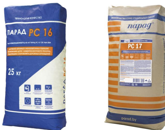
Рисунок 3.1 - Внешний вид заводской упаковки с ремонтными материалами PC 16 и PC 17»

Доставку ремонтных материалов на строительную площадку рекомендуется производить крытым автомобильным транспортом, не допуская увлажнения материалов и повреждения упаковок при перевозках. Мешки с ремонтными материалами должны быть уложены на поддоны и укрыты термоусадочной пленкой. Температурный режим перевозки ремонтных материалов не регламентируется.