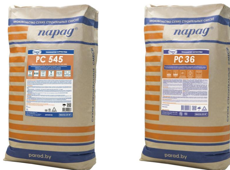
Рисунок 3.2 – Внешний вид заводских упаковок с материалами «РС 545» и РС 36

Внешний вид заводской упаковки ремонтных материалов приведен на рисунке 3.2. Каждая заводская упаковка ремонтного материала должна иметь маркировку, которая должна соответствовать требованиям СТБ 1464.